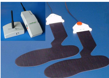
2 pav. Sensoriniai padeliai